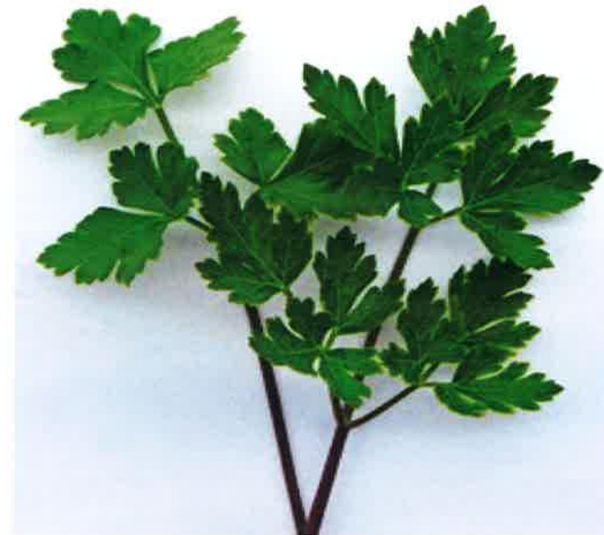
イタリアンパセリ